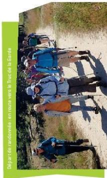
Départ de randonnée en route vers le Truc de la Gardie

Les structures qui assurent la gestion du site (Département de Haute-Loire et SMAT du Haut-Allier) rencontrent les élus lors de la réunion du comité de pilotage et de manière individuelle afin de présenter les projets en cours et leur présenter les résultats d'études menées sur le site.