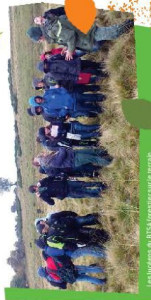
Les ligendes du BTSA forestier sur le terrain