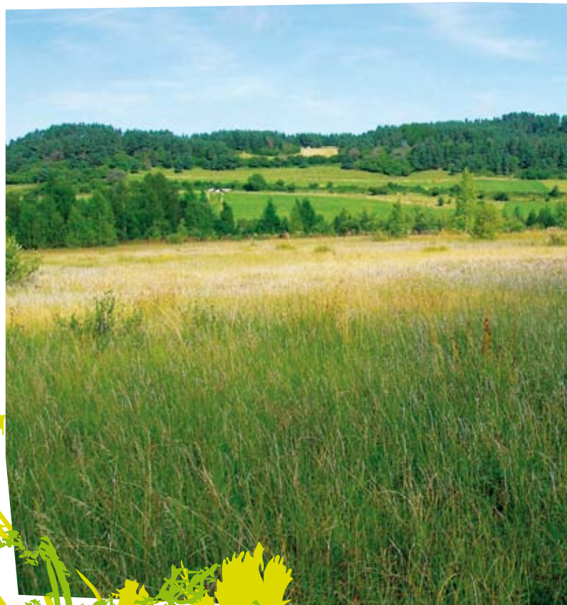
Prairie de fauche

Exemple d'engagement de la charte : Ne pas retourner les prairies naturelles fauchées et/ou pâturées, pacage et landes