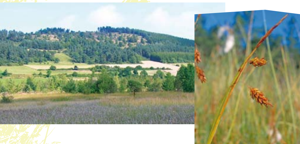
Laïche des Bourbiers