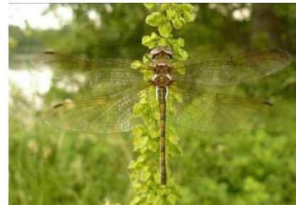
Cordulie à corps fin