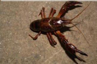
Écrevisse de Louisiane

Et si possible, je prends une photo de mon observation.