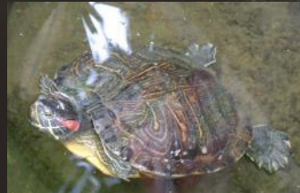
Tortue de Floride