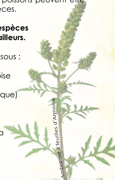
Ambrosie à feuilles d'Armoise